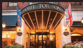
神戸トアロードホテル山楽 TEL: 078-391-6691