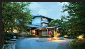
那須温泉山楽 TEL: 0287-76-3010