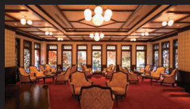
金沢白鳥路ホテル山楽 TEL: 076-222-1212