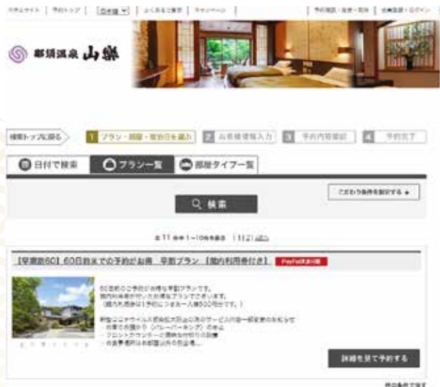
公式サイト GoTo 対象プラン一例