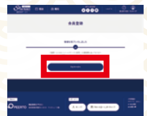
会員登録完了画面