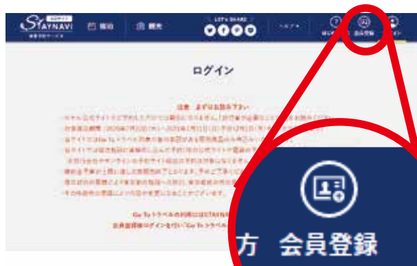
STAYNAVI ログインページ https://staynavi.direct/login

既に、会員登録がお済の方はログインください。 (新規会員登録の場合)「ログイン画面」が表示されますので、右上にある「会員登録ボタン」をクリックします。